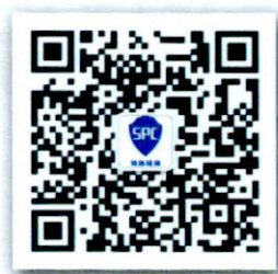
中心官方微信公众号